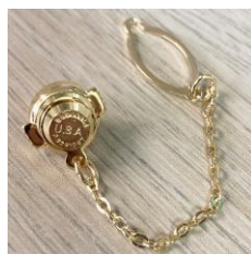
タイタックキャッチ大 鎖付 ゴールド