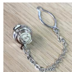
タイタックキャッチ大 鎖付 代用ロジウム